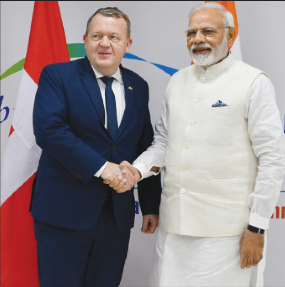
प्रधान मंत्री, श्री नरेंद्र मोदी डेनमार्क के प्रधान मंत्री से मिलते हैं। श्री लार्स लोके रस्सुसेन, गुजरात के गांधीनगर में महाम्ता मंदिर में 9 वें जाइब्रेंट गुजरात ग्लोबल समिट के मौके पर।