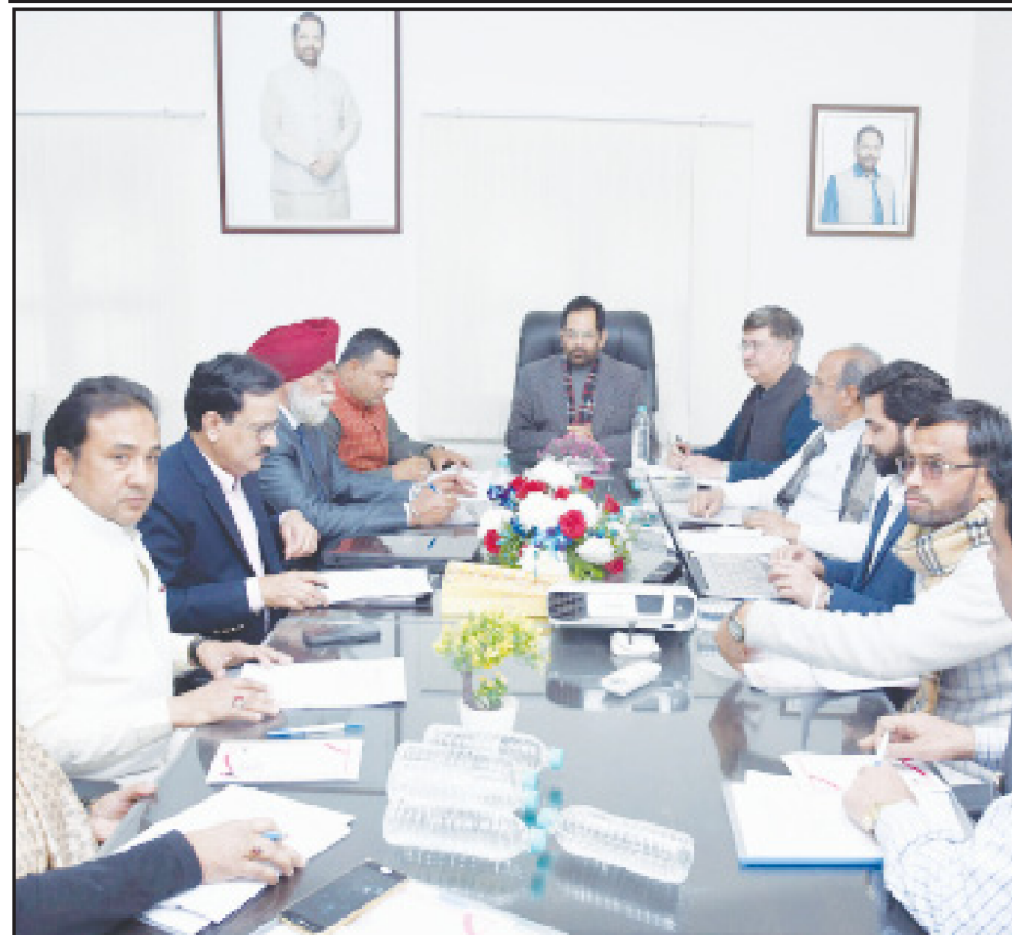
The Union Minister for Minority Affairs, Shri Mukhtar Abbas Naqvi chairing the Governing Body meeting of Maulana Azad Education Foundation (MAEF), in New Delhi.