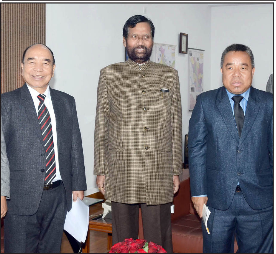
The Chief Minister of Mizoram, Shri Zoramthanga meeting the Union Minister for Consumer Affairs, Food and Public Distribution, Shri Ram Vilas Paswan, in New Delhi.