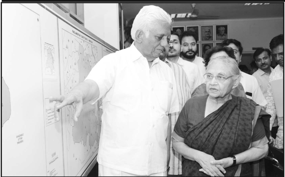
DPCC President Smt. Sheila Dikshit inaugurating control room for Lok Sabha Elections at Rajeev Bhawan.